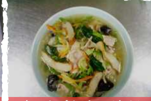
ちゃんぽんメン 650円