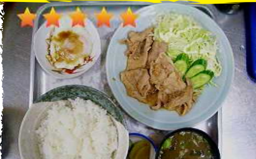
ショウガヤキ定食 1000円