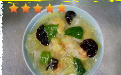
チャーレントンメン 700円