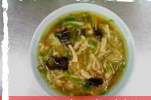
ロースタンメン 750円