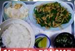
チンジャオロース定食 900円